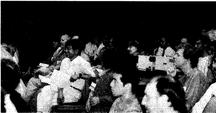
第4図 “つどい”の講演会場の模様