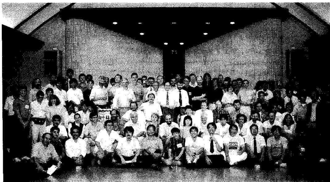
第1図 “つどい” 全参加者の記念写真